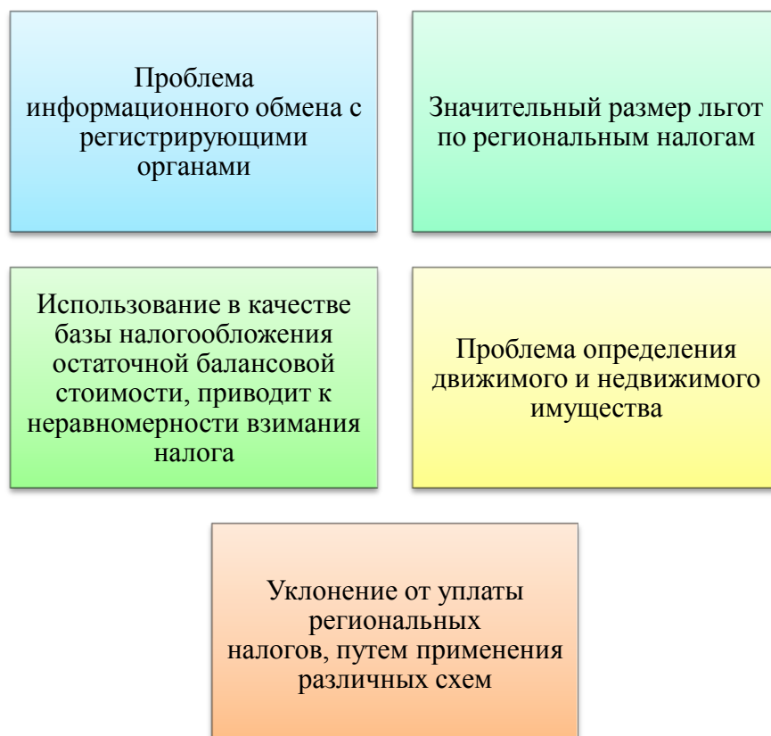
Рисунок 3 – Проблемы, связанные с исчислением и уплатой региональных налогов