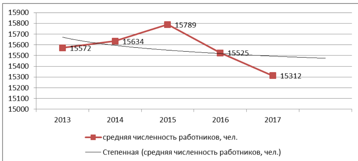
Рисунок 2 – Прогноз показателя средней численности работников АО «РТК» на среднесрочную перспективу.

На рисунке 2 нами представлен прогноз показателя средней численности работников ЗАО «РТК».