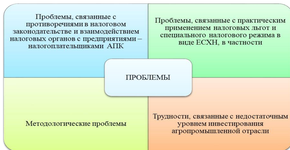
Рисунок 1 – Проблемы, связанные с налоговым администрированием сельскохозяйственных товаропроизводителей

Несмотря на наметившиеся положительные тенденции, все же имеется множество проблем, связанных с администрированием и применением ЕСХН (рисунок 1).