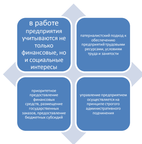
Рисунок 1 – Признаки частно-государственного или частно-муниципального предпринимательства в условиях рыночной экономики

Поскольку в последние годы в связи с экономической ситуацией в регионах происходит сокращение бюджетных расходов на финансирование социально-значимых проектов, необходимо активно использовать потенциал частного бизнеса. Признаки частно-государственного или частно-муниципального предпринимательства в условиях рыночной экономики отражены нами на рисунке 1.