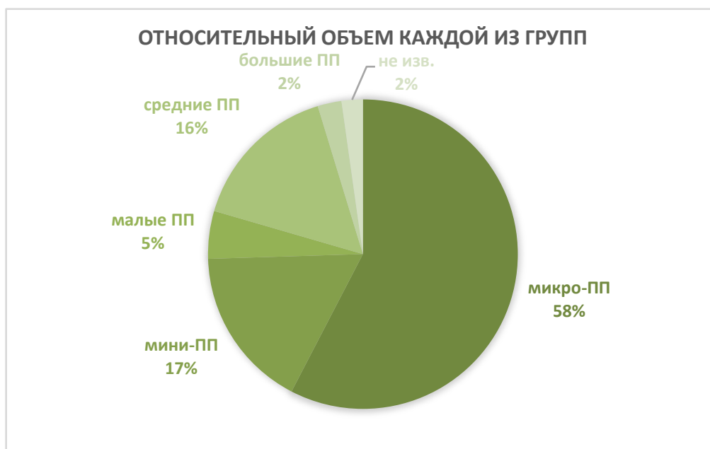
Рисунок 2. Распределение предприятий ИТ-отрасли Ростовской области, ОКВЭД 62, по группам

На Рисунке 2 приведено сравнительное распределение количества работающих (человек) и количества предприятий ИТ-отрасли Ростовской области, ОКВЭД 62, по пяти группам.