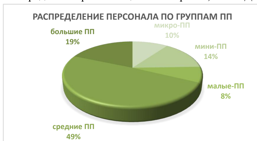
Рисунок 1. Распределение работающих в IT-отрасли РО по группам предприятий в процентном отношении.